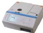
Horiba SLFA-60 Sulfur-in-Oil Analyzer