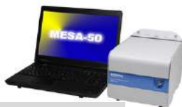
Horiba MESA-50 X-Ray Fluorescence Analyzer