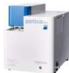
Horiba LA-350 Particle Analyser