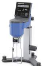
IKA Viscometers Measuring Viscosity