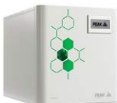
Hydrogen Gas Generator