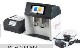
MESA-50 X-Ray Fluorescence Analyzer