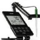
Hanna I-2030 edge Hybrid Multiparameter EC Meter