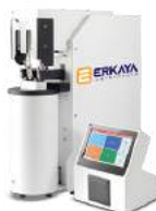
Falling Number Analyzer